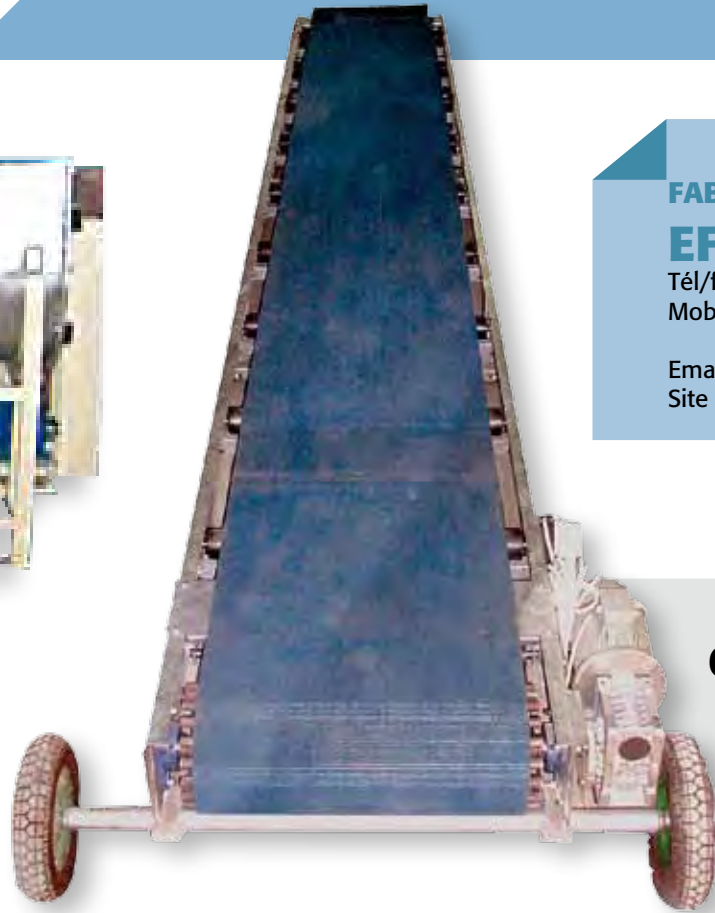
CONVOYEUR À BANDE