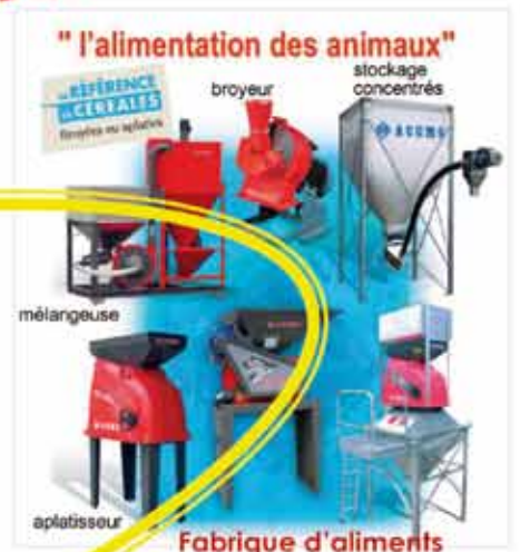
" l'alimentation des animaux "