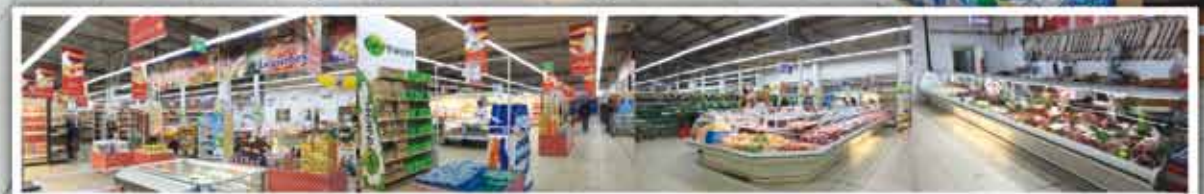
Familishop Hypermarché - Ben Boulaïd - à l'entrée de Blida - www.familishop.net