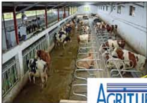
Barrières, logettes cornadis, cases à veau

Le vrai " professionnel " en Algérie, visitez notre site: www.matelevageservices.com