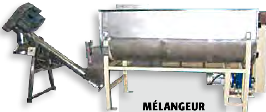
MÉLANGEUR EN INOX POUR POUDRE