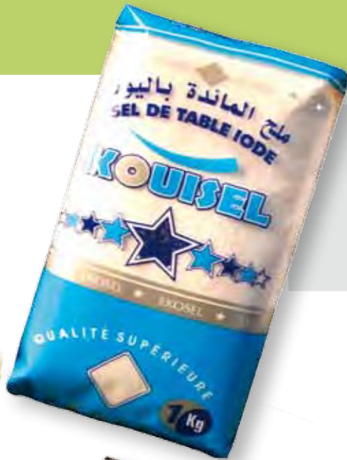
KOUISEL Sel de table iode extra fin