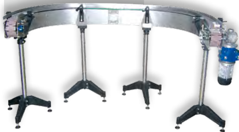
CONVOYEUR À CHAÎNE DOUBLE VIRAGE