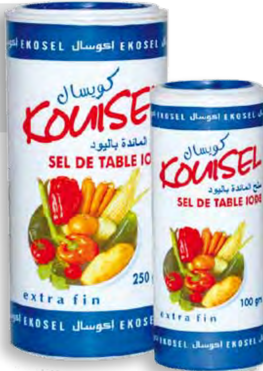
KOUISEL Sel de table iode Extra fin 100 Grs et 250 grs