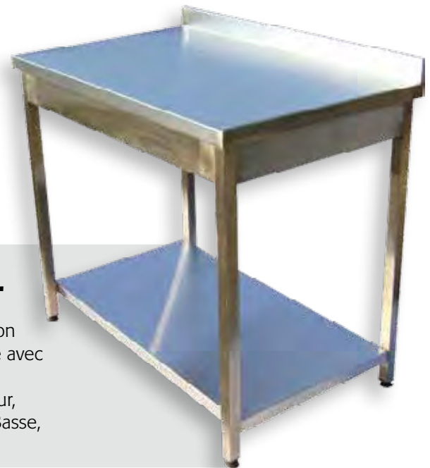
TABLE DE TRAVAIL

Volume jusqu'à 1000 Litres double parois