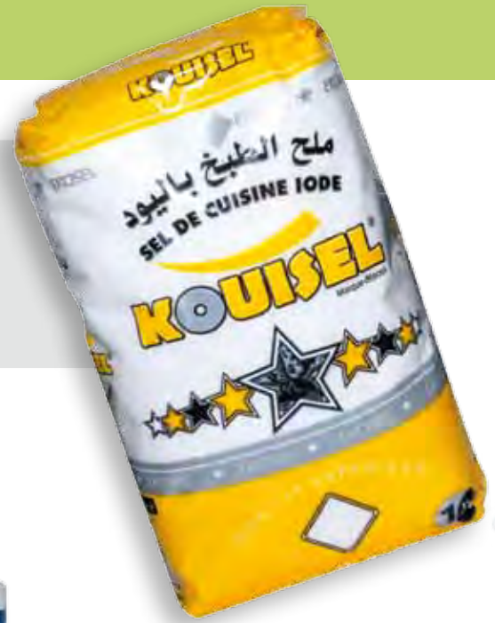
KOUISEL Sel de cuisine iode fin