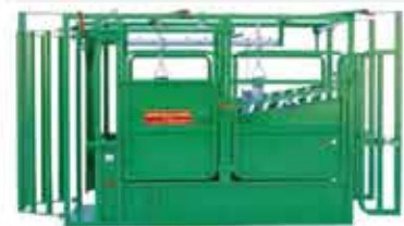
Pesage et contention