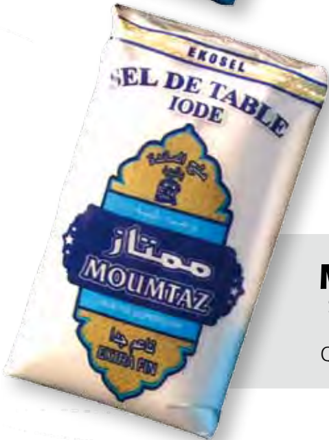
MOUMTAZ Sel de table iode Extra fin raffiné Qualité Supérieure