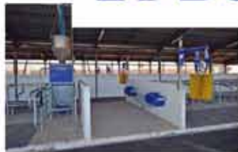
Salle de traite, remorque mélangeuse, alimentation programmée abreuvoirs, tapis